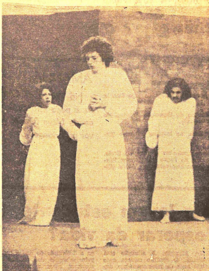
Transe, no Teatro de Câmara, hoje e amanhã